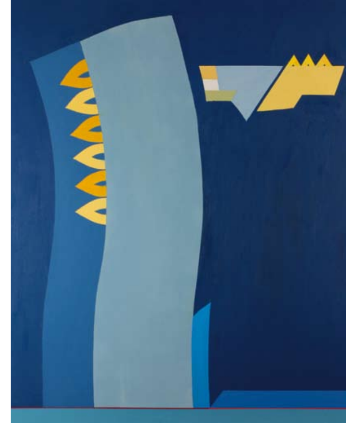
Komposition VIII / 2001, 91×109,5 cm, Öl auf Hartfaser

Die Zeichnungen, Graphiken und Bilder sind thematisch im Grenzbereich zwischen Abstraktem und Gegenständ-