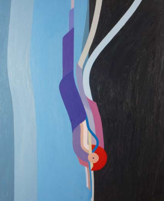
Komposition XV / 1991, 73×91 cm, Öl auf Hartfaser

Das Werk von Bernhard Hofer wird hauptsächlich von zwei Techniken getragen: der Zeichnung in Tusche beziehungsweise Bleistift sowie der Ölmalerei. Es wird überwiegend von der graphischen Auseinandersetzung mit dem räumlichen Phänomen beherrscht. Kleine, flüchtige Skizzen tragen bereits den Keim des Genius in sich, der sich in den markanten Zeichnungen in Tusche und Bleistift in einer klaren und präzisen Ausdrucksform entfaltet. Ohne ihren autonomen Status einschränken zu müssen, liegen sie oftmals den späteren Werken der Ölmalerei zugrunde und charakterisieren diese in ihrer Neuheit und Einzigartigkeit. Während die Ölmalerei in seinem Frühwerk sich pastos und flächenübergreifend zeigt, manifestieren später Linien und Flächen durch ihre Klarheit und Reinheit zwar die kompositorischen Gesetze, denen aber die Welt der Farben als eine gleichwertige Bedeutung zugestanden wird: monochrome Farbfelder und Bänder verleihen dem formalen Stil Lebhaftigkeit und Entschlossenheit.