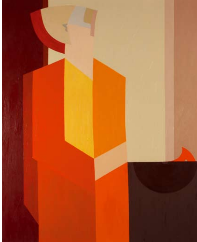
Komposition X / 1991, 100×130 cm, Öl auf Hartfaser

Das Werk von Bernhard Hofer wird hauptsächlich von zwei Techniken getragen: der Zeichnung in Tusche beziehungsweise Bleistift sowie der Ölmalerei. Es wird überwiegend von der graphischen Auseinandersetzung mit dem räumlichen Phänomen beherrscht. Kleine, flüchtige Skizzen tragen bereits den Keim des Genius in sich, der sich in den markanten Zeichnungen in Tusche und Bleistift in einer klaren und präzisen Ausdrucksform entfaltet. Ohne ihren autonomen Status einschränken zu müssen, liegen sie oftmals den späteren Werken der Ölmalerei zugrunde und charakterisieren diese in ihrer Neuheit und Einzigartigkeit. Während die Ölmalerei in seinem Frühwerk sich pastos und flächenübergreifend zeigt, manifestieren später Linien und Flächen durch ihre Klarheit und Reinheit zwar die kompositorischen Gesetze, denen aber die Welt der Farben als eine gleichwertige Bedeutung zugestanden wird: monochrome Farbfelder und Bänder verleihen dem formalen Stil Lebhaftigkeit und Entschlossenheit.