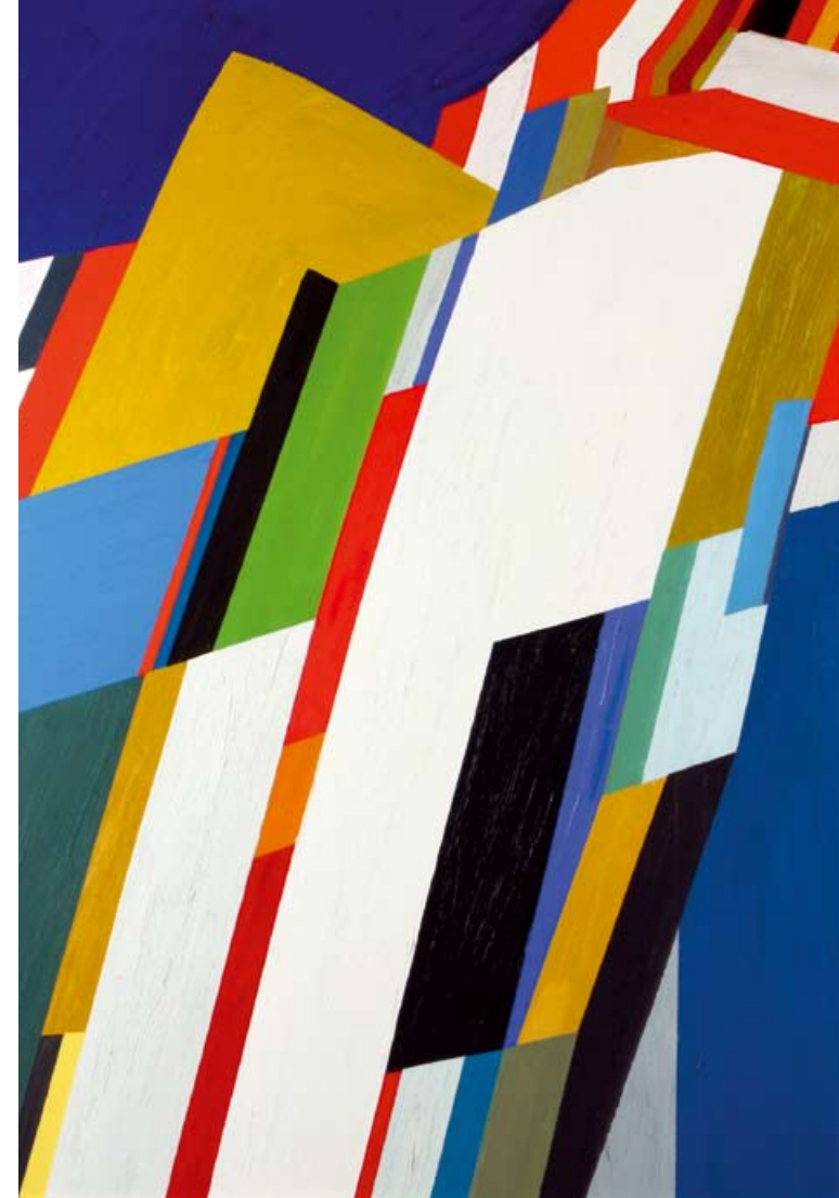
Abbildung Titelseite: Komposition III / 1985 (Ausschnitt), 79 x 93 cm, Öl auf Hartfaser